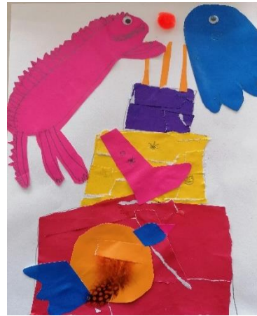
POŠASTNO DOBRA TORTA ELA L. T.